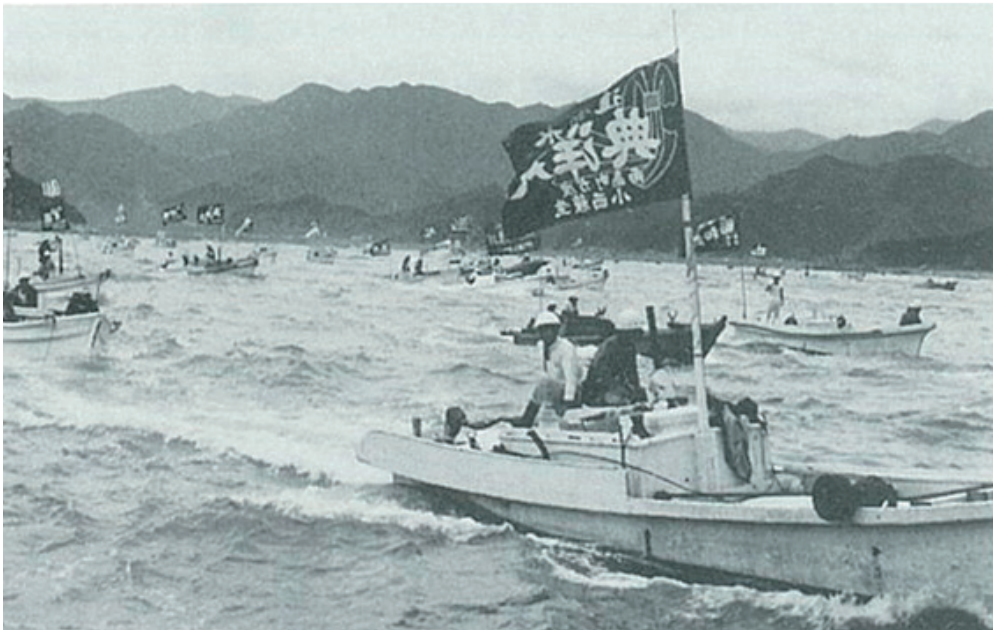
Fischerprotest gegen den Politiker-Besuch am 19. September 1966

Im September 1967 erklärte der damalige Präsident der Provinz Mie (Satoru TANAKA) „Ich mache dem Streit ums AKW ein Ende“, um die AKW-Pläne erst einmal zurückzustellen. Auf diese Weise war der Kampf erst einmal zugunsten der AKW-Gegner entschieden. Trotzdem kam die Auseinandersetzung in den 1970er Jahren erneut in Gang.