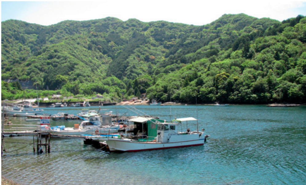
Kowaura nach dem Streit

Den Unterschied zwischen Japan und Deutschland kann man nicht zuletzt auch gerade an der Situation nach den dortigen Auseinandersetzungen ablesen. So ist z.B. in den heutigen Erzählungen in der Gegend Kowaura, wo damals der Widerstand gegen AKW Ashihama geleistet wurde, Letzterer oft mit bitteren Erlebnissen und negativen Erfahrungen verbunden. Sogar die damaligen eigentlich siegreichen AKW-Gegner wollen nicht über ihre Erinnerungen an den Auseinandersetzungen sprechen. Als beispielsweise die Gemeinde Kowaura einmal vorschlug, ein Denkmal des Widerstandes im Ort zu errichten, lehnte die dortige Bevölkerung diesen Vorschlag ab. Denn ein derartiges Denkmal würde sie immer an die bittere Zeit – als die Bewohner gespalten, ja oftmals sogar verfeindet waren und miteinander stritten - erinnern, sooft sie an ihm vorbeigingen und es sähen. Für die Leute in Kowaura ist das Erlebnis des Widerstands eine Erinnerung, die sie möglichst verdrängen wollen. Auch in Maki ist der damaligen Widerstands ein Tabuthema, wenn man mit Anderen zusammenkommt.