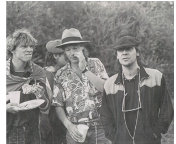
Stars des 5. WAAhnsinnsfestivals